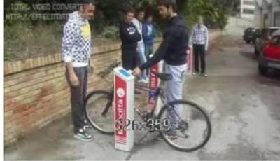
E BIKE SHARING I.I.S. "Alessandrini-Marino" Istituto tecnico industriale ultimo aggiornamento 04/11/2011

34 voti - N° 45 su 171 video Hai già votato per questo video, il tuo voto: 5