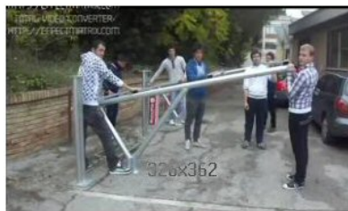
E BIKE SHARING I.I.S. "Alessandrini-Marino" Istituto tecnico industriale ultimo aggiornamento 04/11/2011

34 voti - N° 45 su 171 video Hai già votato per questo video, il tuo voto: 5