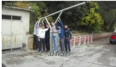
E BIKE SHARING I.I.S. "Alessandrini-Marino" Istituto tecnico industriale ultimo aggiornamento 04/11/2011

34 voti - N° 45 su 171 video Hai già votato per questo video, il tuo voto: 5