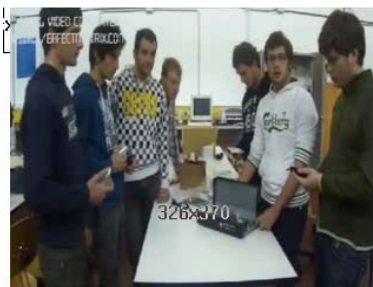
E BIKE SHARING I.I.S. "Alessandrini-Marino" Istituto tecnico industriale ultimo aggiornamento 04/11/2011

34 voti - N° 45 su 171 video Hai già votato per questo video, il tuo voto: 5